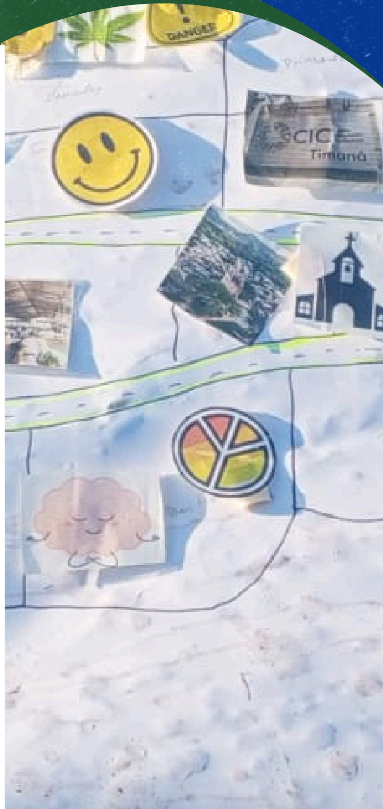
Foto Cartografía Social Municipio Timaná

Sus voces fueron escuchadas y en conjunto se logró identificar los lugares seguros que ofrece el territorio y que desde el desarrollo de la modalidad se podían fortalecer.